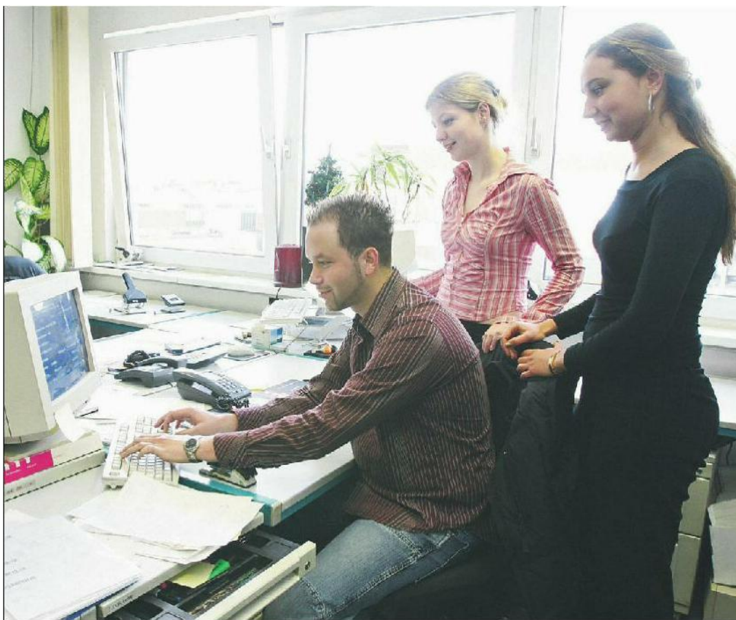
KV-Lehrstellen sind auf der Homepage für anonymisierte Bewerbungen besonders gefragt.

www.we-are-ready.ch ; www.smartselection.ch